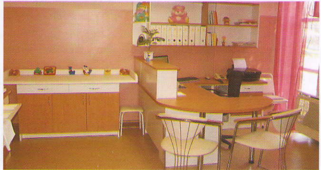
A megújult ostorosi védőnői iroda